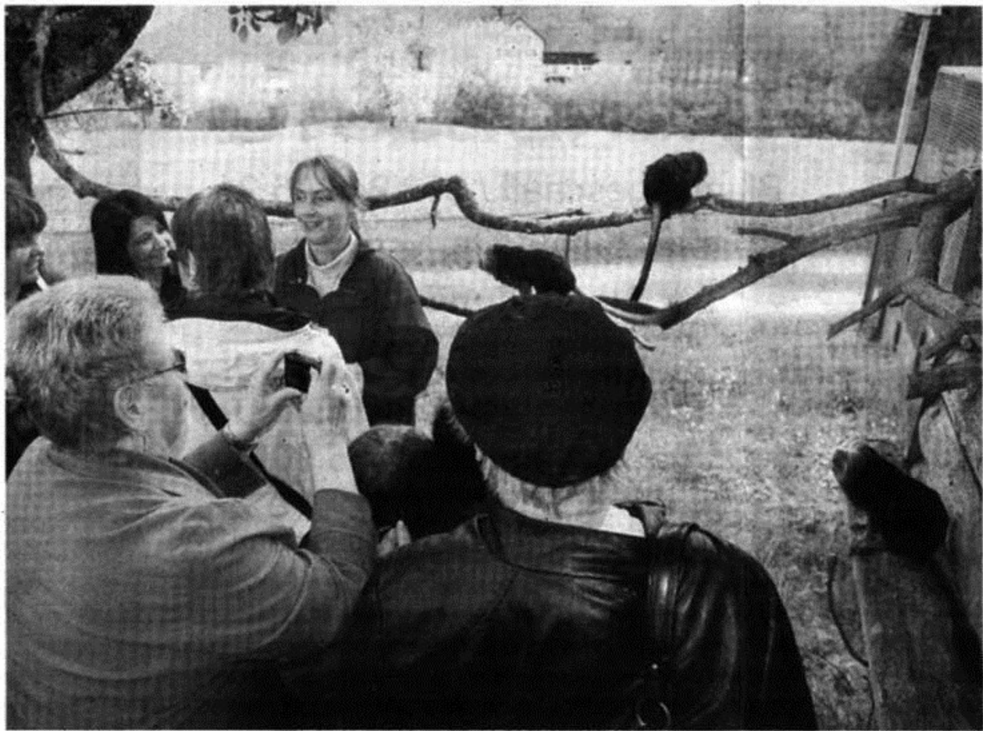
Die Goldkopf-Löwenäffchen haben die Besucher begeistert.